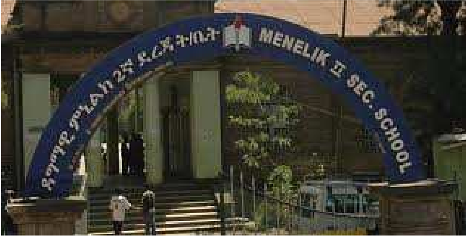
ምስል 1.14 ምኒልክ 2ኛ ደረጃ ትምህርት ቤት

በኢትዮጵያ የመጀመሪያው ዘመናዊ ትምህርት ቤት የዳግማዊ ምኒልክ 2ኛ ደረጃ ት/ቤት ነበር። ይህ ትምህርት ቤት በአሁኑ ወቅት በአዲስ አበባ ከተማ አራት ኪሎ በሚባለው ሥፍራ ይገኛል። የዳግማዊ ምኒልክ 2ኛ ደረጃ ትምህርት ቤት የተቋቋመው በ1900 ዓ.ም (እ.ኤ.አ በ1908) ነው።