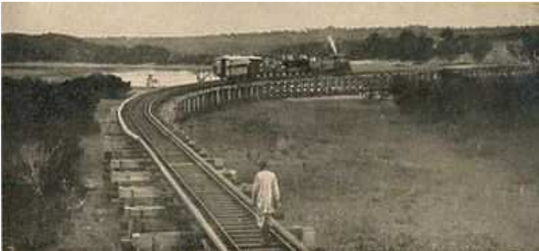
ምስል 1.13 የባቡር ሐዲድ

የባቡር መንገድ ዘመናዊ የመጓጓዣ አውታር ነው። የባቡር ሐዲድ ለመጀመሪያ ጊዜ በኢትዮጵያ የታወቀው በ1886 ዓ.ም (እ.ኤ.አ በ1894) ነበር። አዲስ አበባን ከጅቡቲ ጋር በባቡር መስመር ለማገናኘት ከአንድ የፈረንሳይ ኩባንያ ጋር የስምምነት ውል ተፈርሟል። የሐዲድ መስመሩ ግንባታ የተጀመረው በ1891 (እ.ኤ.አ በ1898) ነበር። በ1910 (እ.ኤ.አ በ1917) የሐዲድ መስመሩ አዲስ አበባ ደርሷል።