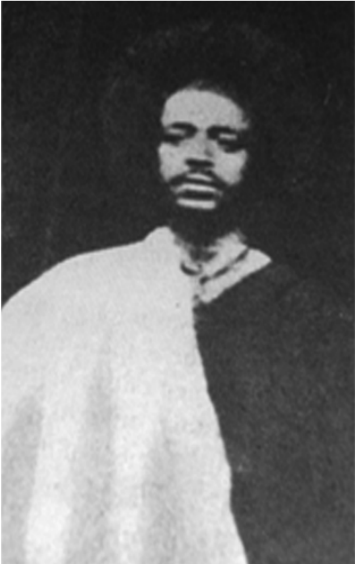
ምስል 1.12 ታቶ ጋኪ ሼረቾ

ከፋ በመካከለኛው ዘመን ከጎጆብ ወንዝ በስተደቡብ በኢትዮጵያ ከነበሩት መንግሥታት አንዱ ነበር። የከፋ መንግሥት ሕዝብ ከፊቾ በመባል ይታወቃል። አሁንም ሆነ ቀድሞ የከፊቾ ሕዝብ መኖሪያ በደቡብ ምዕራብ ኢትዮጵያ ነው። ከፊቾዎች የኢትዮጵያ ኦሞቲክ ቤተሰብ ቋንቋ ተናጋሪ ሕዝቦች ናቸው። በወቅቱ የከፋ ምጣኔ ሀብት የተመሠረተው በግብርና ላይ ነበር። አካባቢው ለኢትዮጵያ መካከለኛው ዘመን የረዥም ርቀት ንግድ የአብዛኛዎቹ ሸቀጦች ምንጭም ነበር። የንግድ ሸቀጦቹ ወርቅ፣ ቡናና ዝባድ ነበሩ። ይህ አካባቢ የቡና ተክል መገኛ በመሆን ይታወቃል። ኮፊ (Coffee) የሚለውን የእንግሊዝኛ መጠሪያ ለቡና የተሰጠውም የቡና ተክል ከተገኘበት ከፋ ከሚለው ስያሜ እንደሆነ ይነገራል።