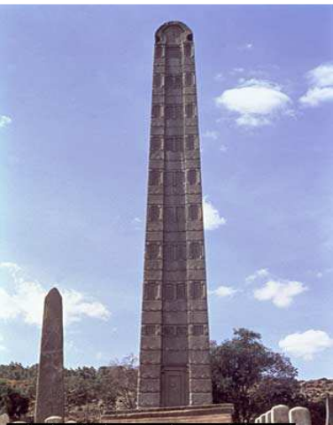
ምስል 1.7 የአክሱም ሐውልት

አክሱም በትግራይ ብሔራዊ ክልላዊ መንግሥት ውስጥ ከሚገኙ ከተሞች አንዷ ናት። አክሱም በአንድ ወቅት የኢትዮጵያና የአፍሪካ ቀንድ አካባቢዎች መዲና ነበረች። በቀድሞ የታሪክ ወቅት ጥንታዊ መንግሥቱም ሆነ ዋና ከተማው አክሱም በመባል ይታወቁ ነበር። ከዚህ በታች ያለውን ሐውልት ተመልከቱ። ይህ ሐውልት የጥንቱን አክሱም ዘመን ሥልጣኔን ይወክላል።