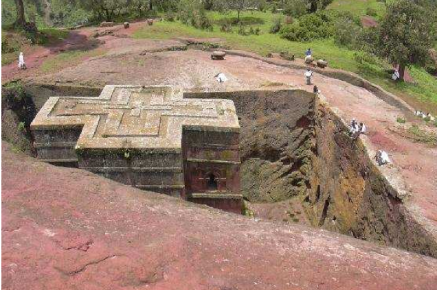
ምስል 1.8 የላሊበላ ውቅር ቤተ ክርስቲያን