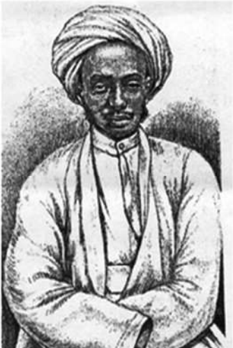
ምስል 1.10 ኢሚር አብዱላሂ

በ17ኛው ክፍለ ዘመን በቀድሞው የአዳል ግዛት አዲስ መንግሥት ብቅ አለ። ይህ መንግሥት የሐረር ኤሚሬት ይባል ነበር። የዚህ መንግሥት መሥራቾች ኤሚር አሊ ኢብን ዳውድ ነበር። ይህ መሪ የሐረር ሕዝብ የገዥ መደብ አባል ነበር። የሐረር ሕዝብ የኢትዮጵያ የሴም ቤተሰብ ቋንቋ ተናጋሪ ነው። የመጨረሻው የሐረር መሪ ኤሚር አብዱላሂ ነበር። በመጨረሻ በ1887 ዓ.ም የሐረር ኤሚሬት የዘመናዊቷ ኢትዮጵያ አካል ሆኗል።