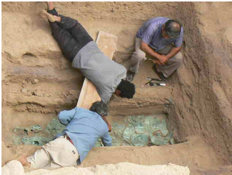
ምስል 1.5 ተመራማሪዎች በቅሪተ አካል ፍሰጋ ላይ

የጥንታዊ ሰው ቅሪተ አካላት ተቆፍረው የሚገኙባቸው ቦታዎች የቅሪተ አካላት መገኛ ሥፍራዎች በመባል ይታወቃሉ። አርዲ፣ ኢዳልቱ፣ ድንቅነሽ(Lucy) እና ሰላም የጥንታዊ ሰዎች ቅሪተ አካላት ናቸው። እነዚህ ማስረጃዎች ከተለያዩ የቅሪተ አካላት መገኛ ሥፍራዎች በቁፋሮ የተገኙ ናቸው።