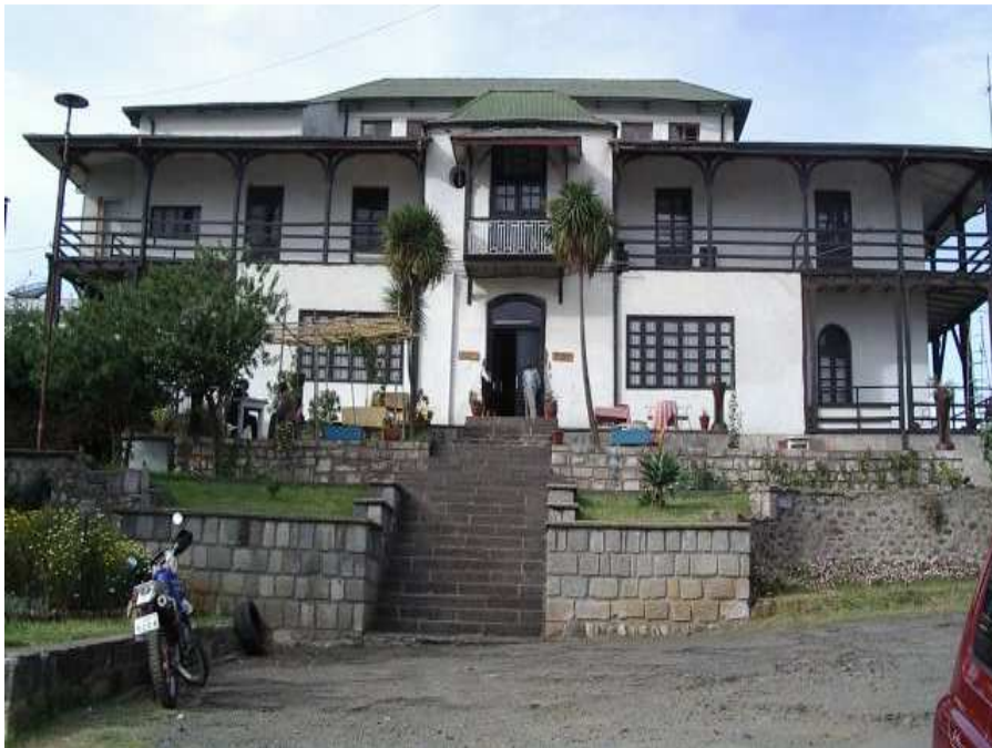
ምስል 1.16 እቴጌ ጣይቱ ሆቴል

በ1899 ዓ.ም (እ.ኤ.አ በ1907) እቴጌ ጣይቱ የመጀመሪያውን ሆቴል አቋቋመ። ያን ጊዜ ሆቴሉ እቴጌ ሆቴል በመባል ይታወቅ ነበር። ይህ ሆቴል አሁን ፒያሳ ውስጥ ይገኛል። በአሁኑ ጊዜ ሆቴሉ እቴጌ ጣይቱ ሆቴል በመባል ይታወቃል።