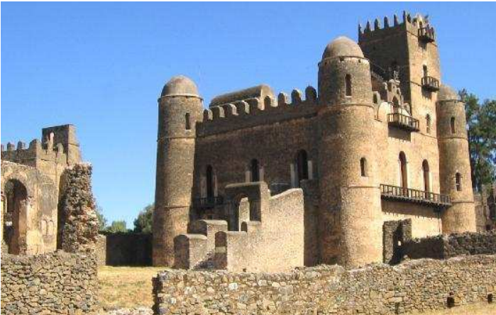
ምስል 1.9 የጎንደር አብያተ መንግሥታት

በታሪክ እንደሚታወቀው በኢትዮጵያ መካከለኛው ዘመን በክርስቲያኖችና በሙስሊም ሠልጣኔት መካከል ረዥም ጊዜ የወሰደ ጦርነት ተካሂዶ ነበር። የግጭቱ መንግሥት በኢትዮጵያ ውስጥ የነበረውን የፖለቲካ ሥልጣንና ንግድን በቁጥጥር ሥር ለማዋል የተደረገ ፉክክር ነበር። ይህ ጦርነት ለክርስቲያኑ መንግሥት ቀስ በቀስ እየተዳከመ መምጣት ምክንያት ሆኗል። በዚህም የተነሣ የክርስቲያኑ መንግሥት ማዕከሉን ከአባይ ወንዝ በስተሰሜን አዛውሯል። በዚህም ምክንያት ጎንደር ዋና ከተማ ሆና ነበር። የክርስቲያኑ መንግሥትም የጎንደር መንግሥት በሚል ስያሜ ይታወቃል። በዚያን ወቅት የነበሩት ብዙዎቹ የጎንደር ነገሥታት በቤተ መንግሥትነት የሚያገለግሉ ሕንፃዎች መገንባት ችለዋል። በአሁኑ ወቅት ሕንፃዎቹ በጎንደር ታዋቂ የቱሪስት መስህቦች ናቸው።(ምስል 1.9 ተመልከቱ)።