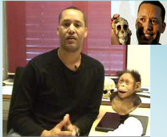
ምስል 1.4 ዶ/ር ዮሐንስ ዘረሰናይ

ዶክተር ዮሐንስ ዘረሰናይ ኢትዮጵያዊ የቅሪተ አካላትና ቅሪተ ቁስ ተመራማሪ (archeologist) ናቸው። ዲኪካ ከሚባል ሥፍራ የጥንታዊ ሴት ቅሪተ አካል ቆፍረው ያወጡ ጠቢብ ናቸው። የቅሪተ አካሏ ስምም ሰላም የሚል መጠሪያ ተሰጥቷታል። የሰላም ቅሪተ አካል የተገኘው በ1998 (እ.ኤ.አ በ2006 ዓ.ም) ነበር። ሰላም ከ3,300,000 ዓመታት በፊት የኖረች ሕጻን ሴት ልጅ ነበረች። በሕጻንነት ዕድሜ የሞተች ቢሆንም ሰላም ድንቅነሽ ከመፈጠሯ ከ120,000 ዓመታት በፊት የኖረች ናት። (ሰንጠረዥ 1.2 ተመልከቱ)።