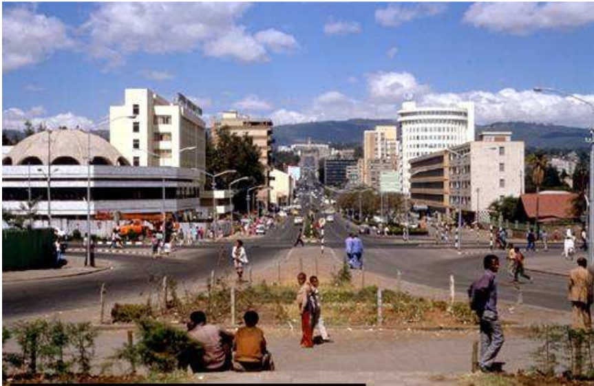
ምስል 1.19 የከተማ አካባቢ የሕዝብ አሰፋፈር

በከፍተኛም ሆነ በዝቅተኛ አካባቢዎች ሁለት ዓይነት ማኅበረሰብ ሊኖር ይችላል። እነርሱም የከተማና የገጠር ሕዝብ ናቸው።