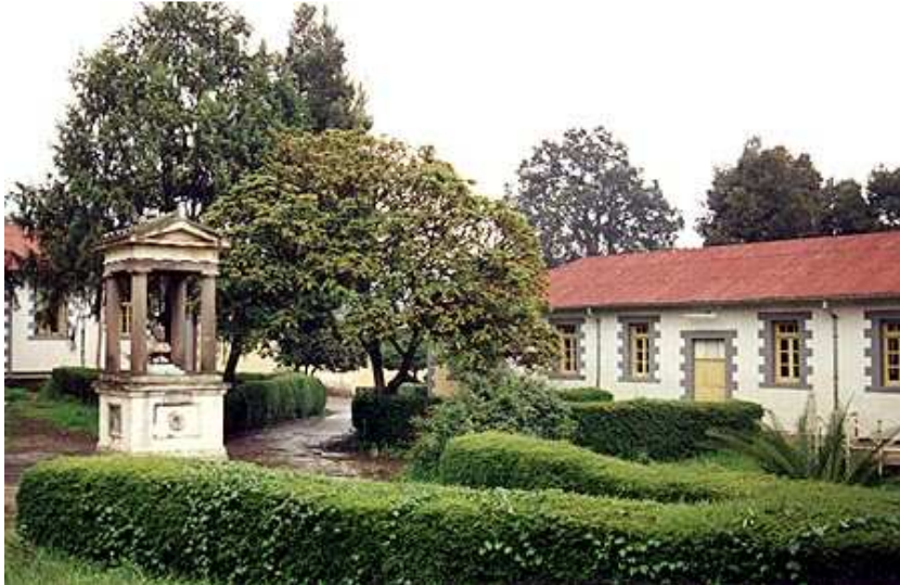
ምስል 1.15 የዳግማዊ ምኒልክ ሆስፒታል