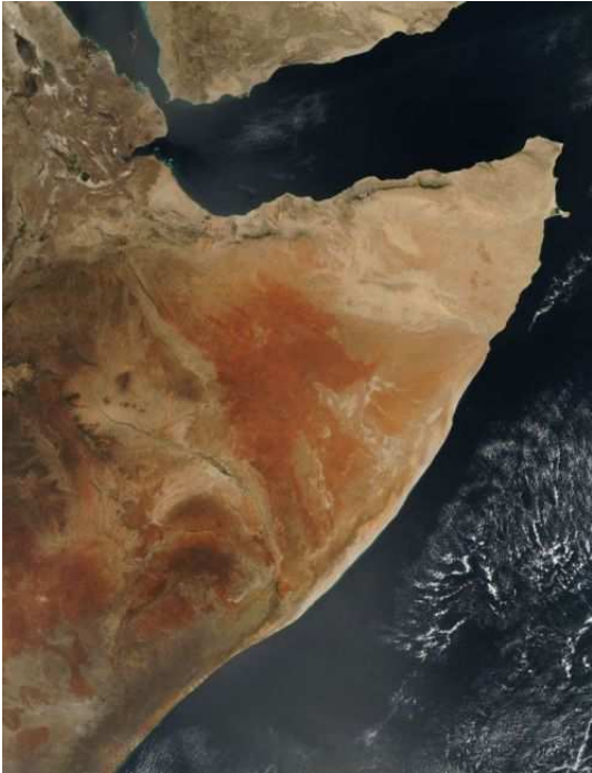
ምስል 1.1 ወደ ሕንድ ውቅያኖስ የገባውን የአፍሪካ ቀንድ ክፍል የሚያሳይ የሳተላይት ፎቶግራፍ

ይህ አካባቢ የአፍሪካ ቀንድ የሚለውን ስያሜ ያገኘው በተፈጥሮ ካለው ቅርጽ አኳያ ነው። በምስል 1.1 እንደምትመለከቱት የአካባቢው ቅርጽ ልክ ቀንድ ይመስላል። በዚህም የአፍሪካ ቀንድ የሚል ስያሜ ተሰጥቶታል።