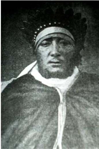
ምስል 1.11 ካዎ ጦና

የወላይታ መሪዎች ካዎ በመባል የሚታወቅ የተከበረ ማዕረግ ነበራቸው። ትርጉሙም ንጉሥ ማለት ነው። የወላይታ መንግሥት ምጣኔ ሀብት የተመሠረተው በግብርና ላይ ነበር። በወቅቱ የሚመረቱት ሰብሎች እንሰት፣ በቆሎ፣ ስንዴ፣ ጉብስ፣ ቡና፣ ትምባሆና ጥጥ ነበሩ። ከዚህ በተጨማሪም ወላይታ ከአጎራባች መንግሥታትና ሕዝቦች ጋር የንግድ ግንኙነት ነበረው። የመጨረሻው የወላይታ ንጉሥ ካዎ ጦና ነበር። በ1886 ዓ.ም (እ.ኤ.አ በ1894) በተደረገው ጦርነት የወላይታ መንግሥት በመሸነፍ የዘመናዊቷ ኢትዮጵያ ግዛት አካል ሆኗል።