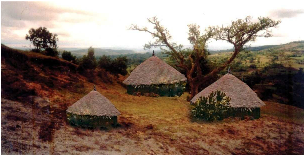
ምስል 1.18 በዝቅተኛ አካባቢ የሚታይ የሕዝብ አሰፋፈር

ምስል 1.17 ከፍተኛ አካባቢዎች የሕዝብ አሰፋፈር ያለውን ገጽታ ያሳያል። ከምስሉ እንደሚታየው በከፍተኛ አካባቢዎች የሕዝብ አሰፋፈር የተጠጋጋ ነው።