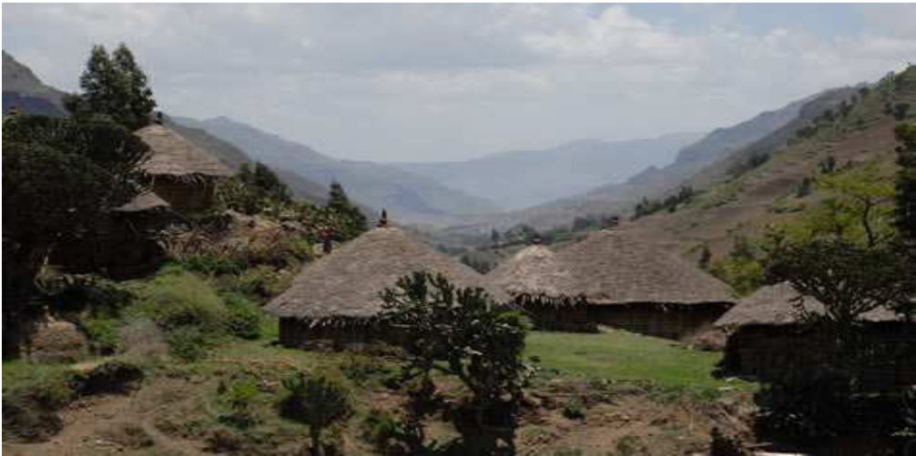
ምስል 1.17 በከፍተኛ አካባቢ የሚታይ የሕዝብ አሰፋፈር

የሕዝብ አሰፋፈር በሁሉም አካባቢዎች ተመሳሳይ አይደለም። በአንዳንድ ቦታዎች ሕዝብ ተጠጋግቶ ይኖራል። በሌሎች ቦታዎች ደግሞ ተበታትኖ ይኖራል። የምጣኔ ሀብት እንቅስቃሴም እንደዚሁ ከቦታ ወደ ቦታ የተለያየ ነው። በአንዳንድ አካባቢዎች በእርሻ ላይ የተመሠረተ አኗኗር ሲታይ በሌሎች ደግሞ በከብት አርቢነት ላይ የተመሠረተ ይሆናል። የእነዚህ ልዩነቶች መንስኤ ምንድን ነው?